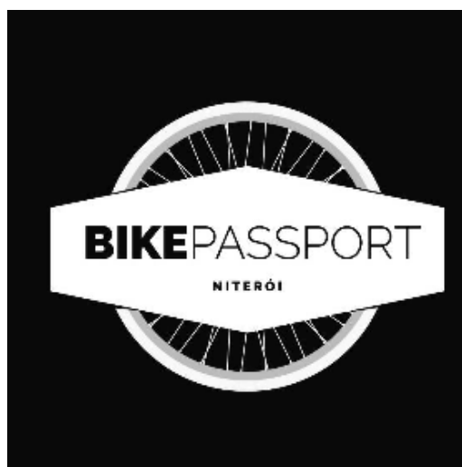
Figura 1: Logomarca do BPN.

2. Marketing 2 - divulgação e promoção: encarregado de revisar os textos de publicação confeccionados pelo Marketing 1. Ficou responsável também pela publicação das postagens na página e divulgação em grupos no Facebook.