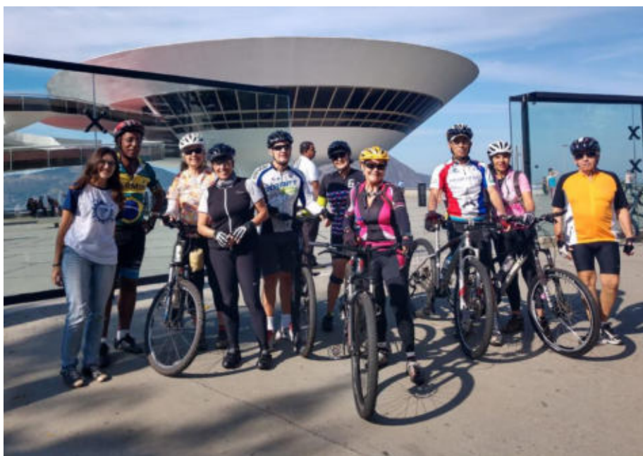
Figura 3: Ciclistas abordados no MAC.

As equipes avaliaram que o desconhecimento do projeto se deu por dois motivos: o alcance limitado das ferramentas de divulgação utilizadas; e, sobretudo, pelo calendário. Vale salientar que a atividade estava inserida dentro de uma proposta pedagógica avaliativa de uma disciplina de graduação. Portanto, prazos foram estipulados para o alcance das metas e cumprimento do cronograma.