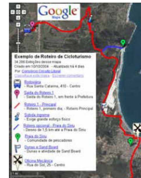
ROTEIRO PLANEJADO NO GOOGLMAPS [POR ANDRÉ GERALDO SOARES]

território nacional, permitindo a identificação bem clara de ruas, rios e até mesmo edificações. Podem ser adicionados símbolos de identificação, fotos, links e vídeos, permitindo que o ciclovianjante conheça todo o roteiro preliminarmente. Além disso, é possível salvar o mapa em arquivo digital (formatos GPX e KML, por exemplo), onde, ainda de maneira fácil, o interessado pode obter as altitudes e as coordenadas geográficas, muito úteis para quem faz uso de aparelhos GPS (Sistema de Posicionamento Global). Um exemplo de mapa, de valor apenas ilustrativo, pode ser conferido em www.tinyurl.com/exrotcic .