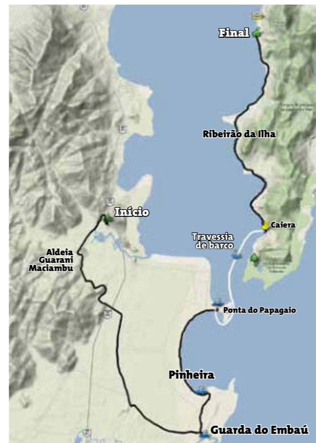
MAPA DE ROTEIRO DE UM DIA [POR CAMINHOS DO SERTÃO]