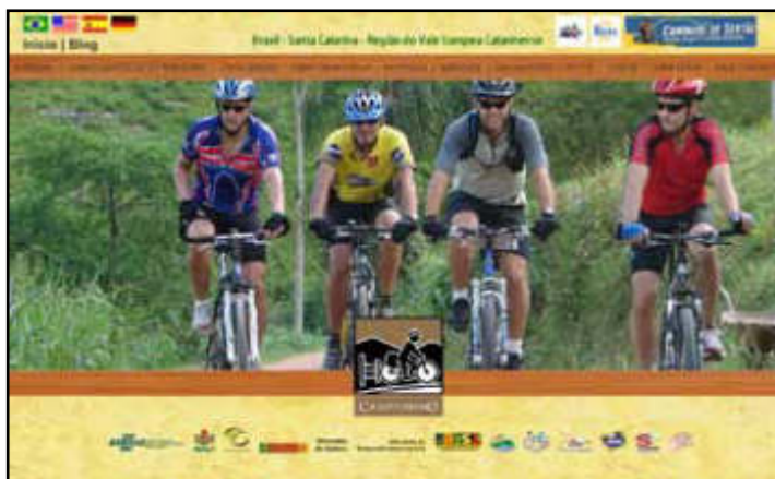
SÍTIO ELETRÔNICO DO CIRCUITO VALE EUROPEU

CIRCUITO DE CICLOTURISMO Acolhida na Colônia Roteiros da Serra Geral SANTA ROSA & ANITÁPOLIS • RANCHO QUEIMADO • URUBICI