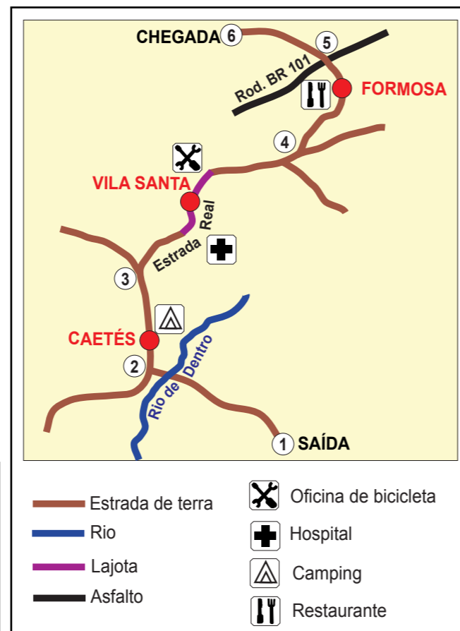
EXEMPLOS DE PLANILHA, MAPA DETALHADO E GRÁFICO ALTIMÉTRICO

Além do guia impresso, é essencial que haja um site na internet com conteúdo sempre atualizado. O site tem diversas vantagens: é consultado por praticamente todos os cicloturistas; facilita a comunicação e a divulgação de forma espontânea pelos interessados; permite atualizações constantes das informações; possibilita a incorporação de muitas informações, como fotos,