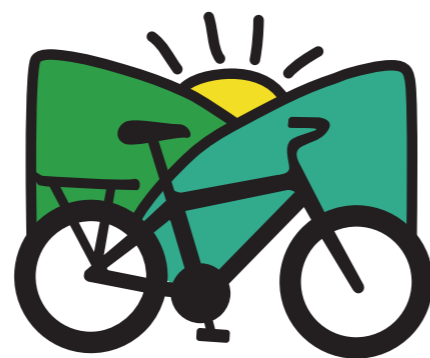
ÍCONE CICLOTURISMO PARA O CIRCUITO ACOLHIDA NA COLÔNIA [POR CAMINHOS DO SERTÃO]

Outras entidades podem gerir o circuito, como é o caso da catarinense Acolhida na Colônia ( www.acolhida.com.br ), associação de agroturismo que envolve agricultores e poder público.