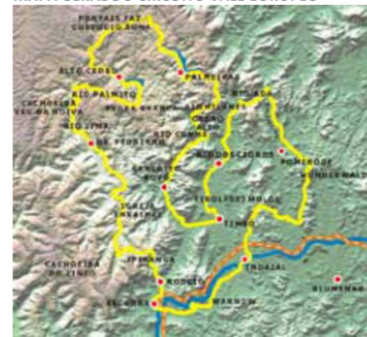
MAPA GERAL DO CIRCUITO VALE EUROPEU

Difícilmente um município possui extensão de estradas de interior e variedade de atrativos suficientes para comportar, sozinho, um Circuito de Cicloturismo, tornando necessário que os municípios envolvidos no percurso ajam em consórcio ou parceria. Portanto, aquele município mais estimulado a criar o circuito deverá procurar os demais para propor o trabalho em conjunto, cabendo a eles o estabelecimento dos termos dessa parceria. Deve-se ressaltar que, desta forma, o trabalho fica mais fácil, por poder contar com maior número de técnicos e gestores públicos e demais parceiros da sociedade para a elaboração do Projeto.