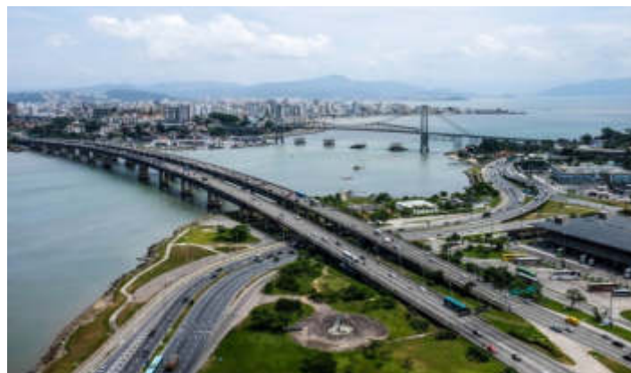
Fig. 3: Pontes Pedro Ivo Campos, Colombo Sales e Hercílio Luz, Florianópolis, SC.