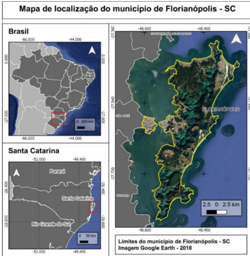
Figura 2 – Mapa de localização do município de Florianópolis, SC.